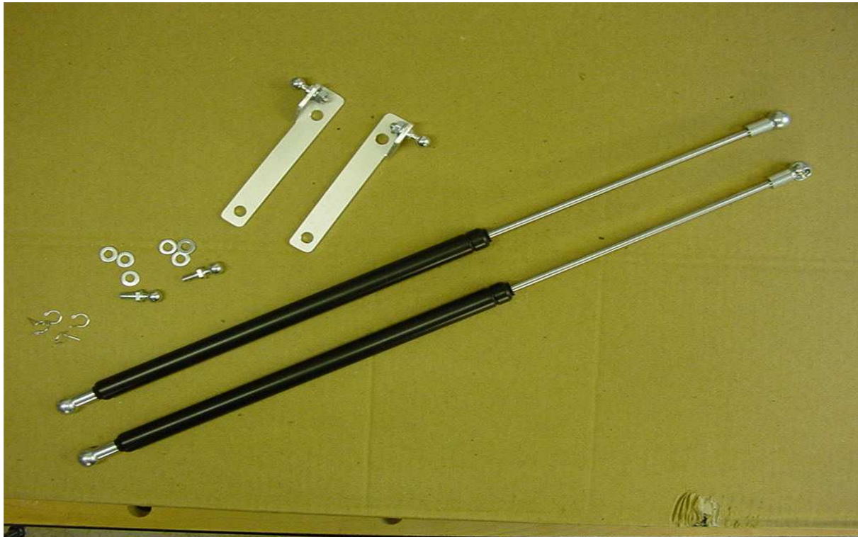
Bild 1 (abgebildet: Motorhaubenlift-Set für Subaru Impreza GD/GG ab MY01)

für Subaru Impreza GD/GG ab MY01 und Subaru Forester SG ab MY04